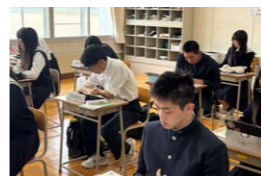
放課後講習・各種模試

放課後講習や面接指導をはじめ進路ガイダンス、マナー講座など、安心して挑戦できる環境を整えています！