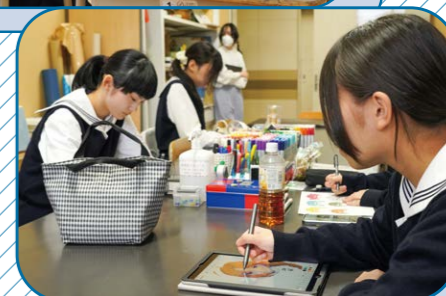
漫画・イラスト研究部