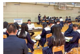
校内進学就職相談会