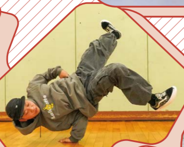
ブレイクダンス部