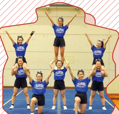
チアリーディング部