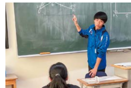
就職インターンシップ