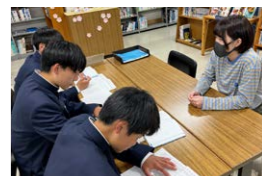
畜大生による個別指導