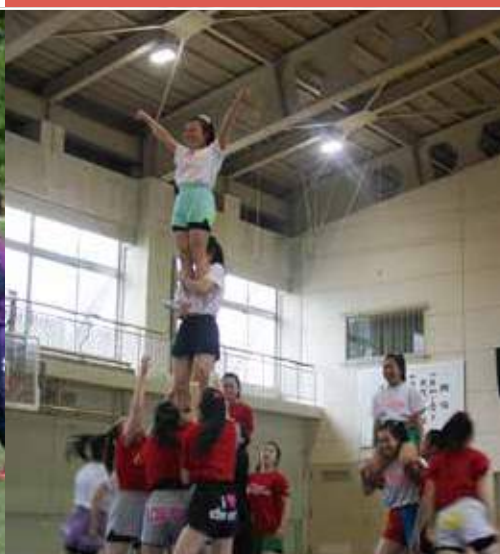
チアリーディング部