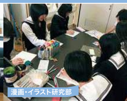
漫画・イラスト研究部