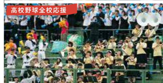
高校野球全校応援