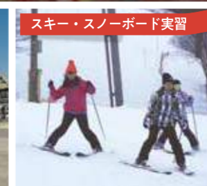
スキー・スノーボード実習